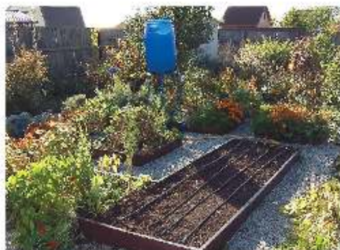
Пример расположения системы капельного полива для упорядоченных посадок на садовом участке.